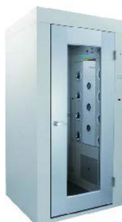
日本エアーテック(株)