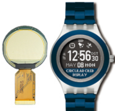
WISECHIP SEMICONDUCTOR Ltd. (台湾)