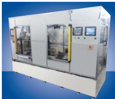
武蔵エンジニアリング(株)