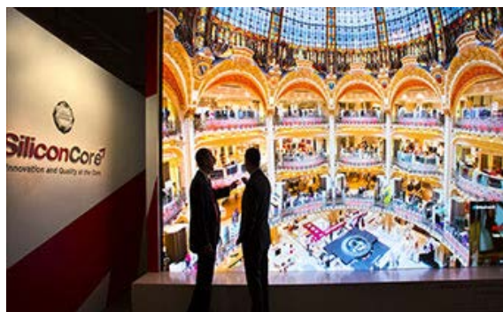
シリコンサイン・ジャパン(同)