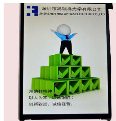
深圳市鸿瑞祥光学有限公司(HRX)

※出展社名、製品等は当日変更となる可能性がございます。 ご紹介する製品は一部抜粋で、展示会の「出展社・製品 検索」および各社 HP より引用しております。予めご了承ください。