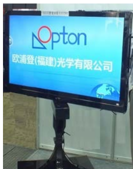
オプトン グループ